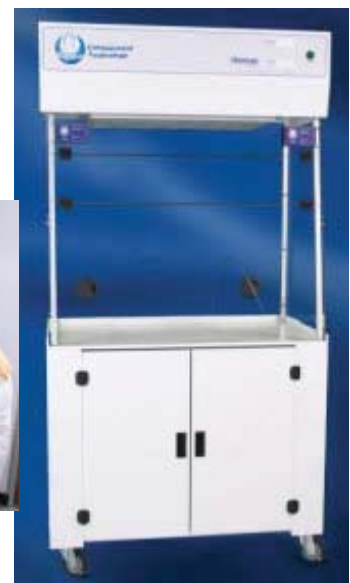
BC1004 sur armoire mobile