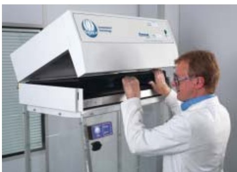
Filtres ChemcapTM facile d'accès