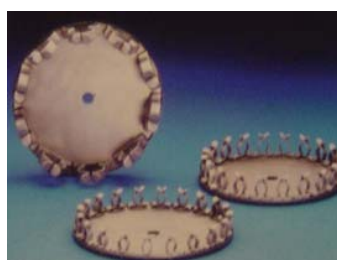
Pour IC 3452/80

C3410/40 Portoir central échantillons avec 104 clips pour tubes de Ø 8-12mm